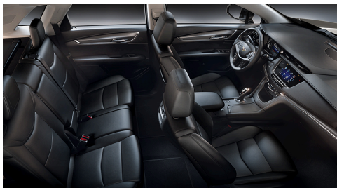
Mulan-Ledersitzflächen in Jet-Black mit perforierten Einsätzen, Jet-Black-Akzente am Armaturenbrett und Ausstattung mit Lunar-gebürstetem Aluminium