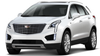
Crystal White Tricoat