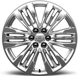
Aluminiumfelgen, 20 Zoll, mit Premium- Lackierung in Sterling Silver