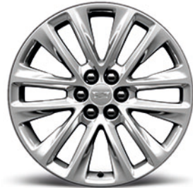
12-Speichen- Aluminiumfelgen, 20 Zoll, poliert