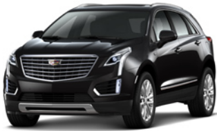
Stellar Black Metallic