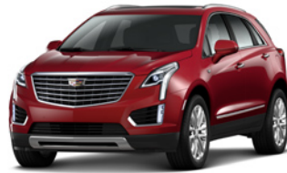
Red Passion Tintcoat