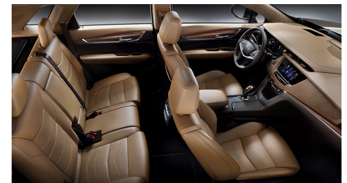
Semianilin-Opusledersitze in Maple Sugar mit chevron-perforierten Einsätzen, Jet-Black-Akzente am Armaturenbrett, Mikrofaser-Veloursleder-Dachhimmel und satinierte Holzausstattung mit Palisander