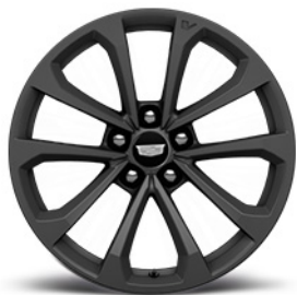
Aluminium-Schmiedefelgen der V-Series, 18 x 9,0 Zoll vorn, 18 x 9,5 Zoll hinten, mit dunkler After-Midnight-Lackierung