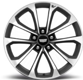
Aluminium-Schmiedefelgen der V-Series, 19 x 9,5 Zoll vorn, 19 x 10,0 Zoll hinten, poliert, mit Midnight-Lackierung-Einsätzen