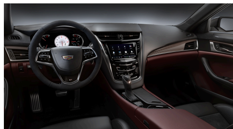
RECARO®- Semianilin-Ledersitze in Jet Black mit Veloursledereinsätzen und Morello-Red-Ziernähten, Morello-Red-Akzente am Armaturenbrett und Türen mit einzigartiger hochglänzender Karbonfaser-Ausstattung in Rot