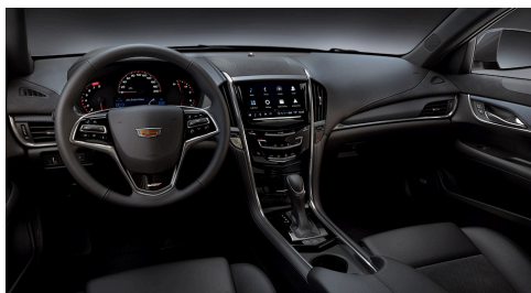
RECARO®-Mulan-Ledersitze in Jet Black mit Veloursledereinsätzen, Jet-Black-Akzente am Armaturenbrett und Karbonfaser-Ausstattung

RECARO®- Semianilin-Ledersitze in Jet Black mit Veloursledereinsätzen und Morello-Red-Ziernähten, Morello-Red-Akzente am Armaturenbrett und Türen mit einzigartiger hochglänzender Karbonfaser-Ausstattung in Rot